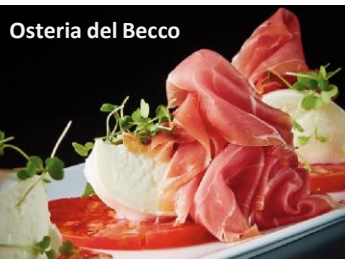
Osteria del Becco